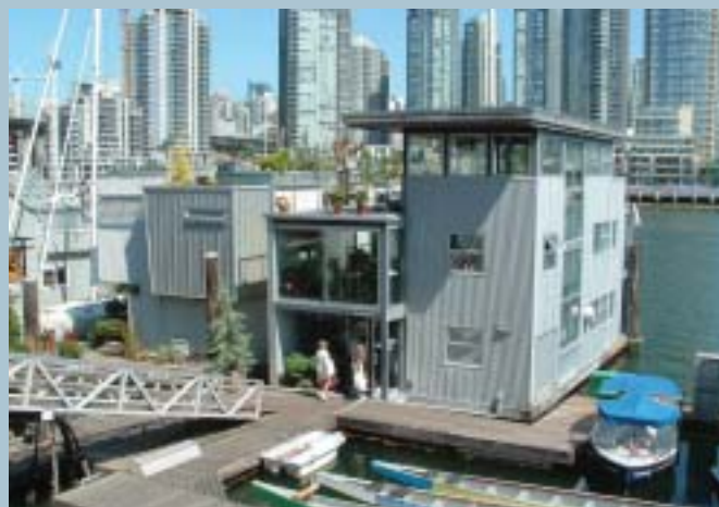
Vancouver.