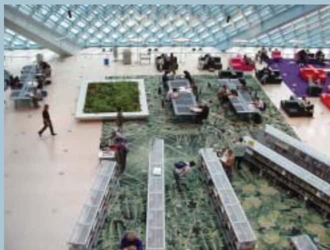
Seattle Public Library. Rem Koolhaas.

Pris kr. 17.800 i delt dobbeltværelse. Tillæg for enkeltværelse kr. 3.650. Prisen inkluderer: Fly KBH-Vancouver og Seattle-KBH inkl. skatter og afgifter, al buskørsel inkl. Vancouver-Seattle, 4 nætter på Granville Island Hotel (Vancouver), 3 nætter på Crowne Plaza Hotel (Seattle), "skyline" sejlture i begge byer samt entré til udvalgte museer, parker og sights. Morgenmad er inkluderet i prisen, resten af forplejningen står deltagerne selv for.