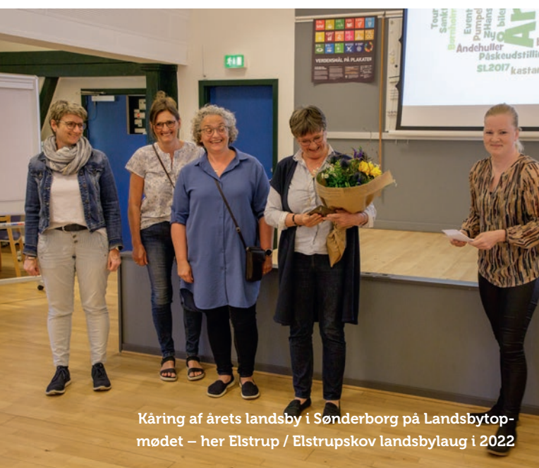
Kåring af årets landsby i Sønderborg på Landsbytopmødet – her Elstrup / Elstrupskov landsbylaug i 2022

Forvaltningens opgave er, at hjælpe med at få det til at ske, og nogle gange være en del af løsningen: "Det handler ikke OM, men HVORDAN tingene kan lykkes".