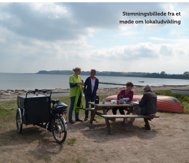
Stemmingsbillede fra et møde om lokaludvikling