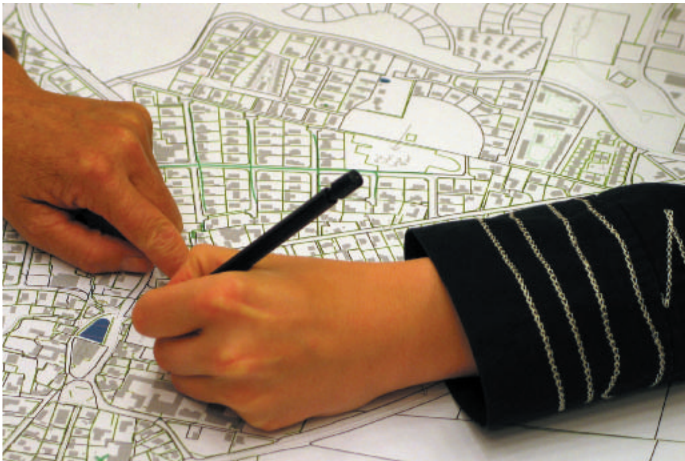
Borgerne i Kirke Hyllinge tegner og fortæller: