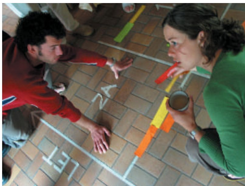
Strategier og tiltag udvælges og prioriteres i workshop.