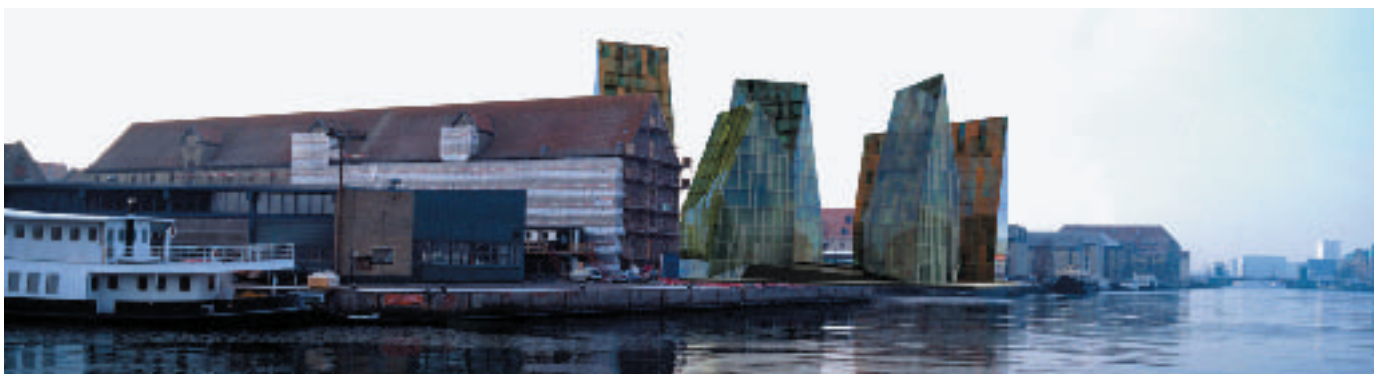
Byggeriets planlagte placering i havneløbet.