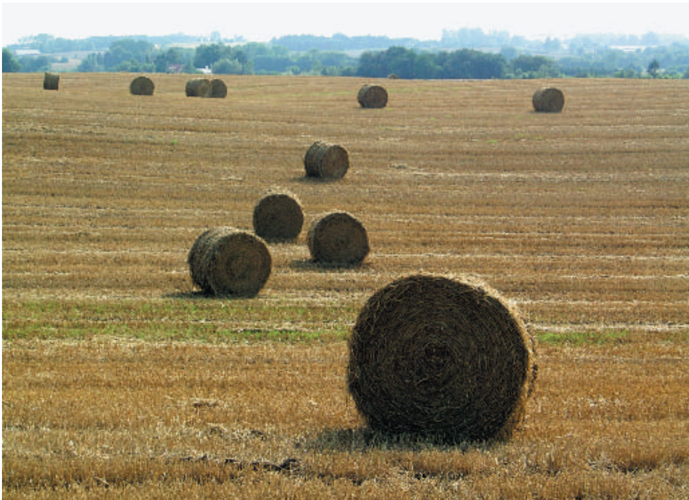
Den organiske sammenhæng mellem kulturhistorie, landskab, arkitektur og dagligt brød bliver erstattet af store industrielle anlæg.