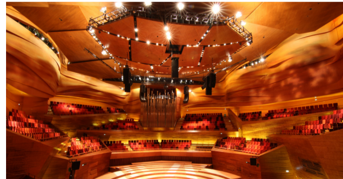
Torsdagens faglige plenumprogram finder sted i DRs fantastiske Koncerthus

Se det samlede program og tilmeld dig på byplanlab.dk