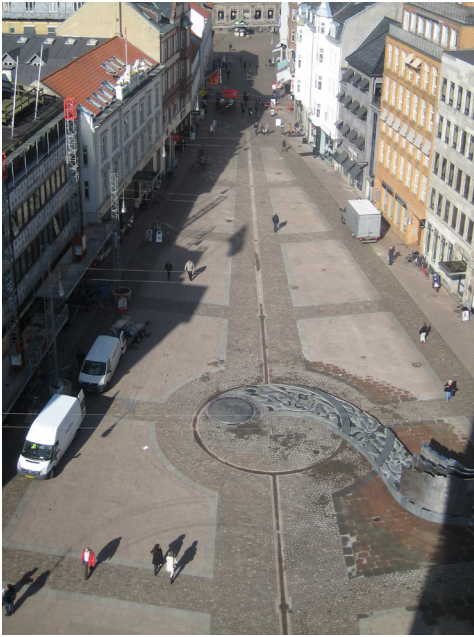
▲ Store Torv: "Naboen" inviteres ind og torv bliver til skov.

af. Erkendelser som nu danner udgangspunkt for fremtidens planlægning. En praksis, vi gerne i fremtiden vil kunne døbe 'Aarhusmodellen' og som kan give borgere, bygherrer og beslutningstagere et bedre erfaringsgrundlag at forme byen efter, end de mere abstrakte tegninger og flade computergenererede billeder vi for det meste støtter os til.